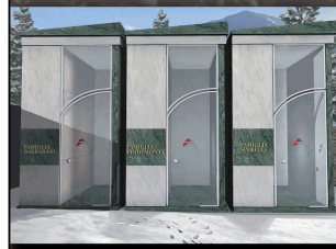
LASTELLA SISTEMI® Rapido Star

Tutta la progettazione, la parte burocratica in documentazione e calcoli strutturali viene fornita dalla Ditta LASTELLA SISTEMI® con garanzia finale. Lo staff di LASTELLA SISTEMI® è a disposizione per qualsiasi richiesta di soluzioni o chiarimento in merito, eventuali preventivi gratuiti e sopralluoghi.