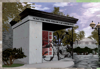
LASTELLA SISTEMI® Rapido Star